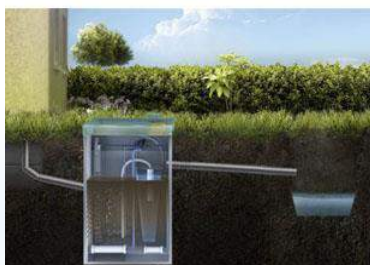
В канаву самотеком