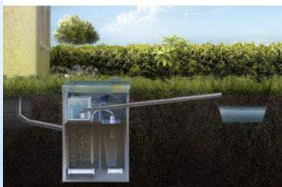
В канаву насосом